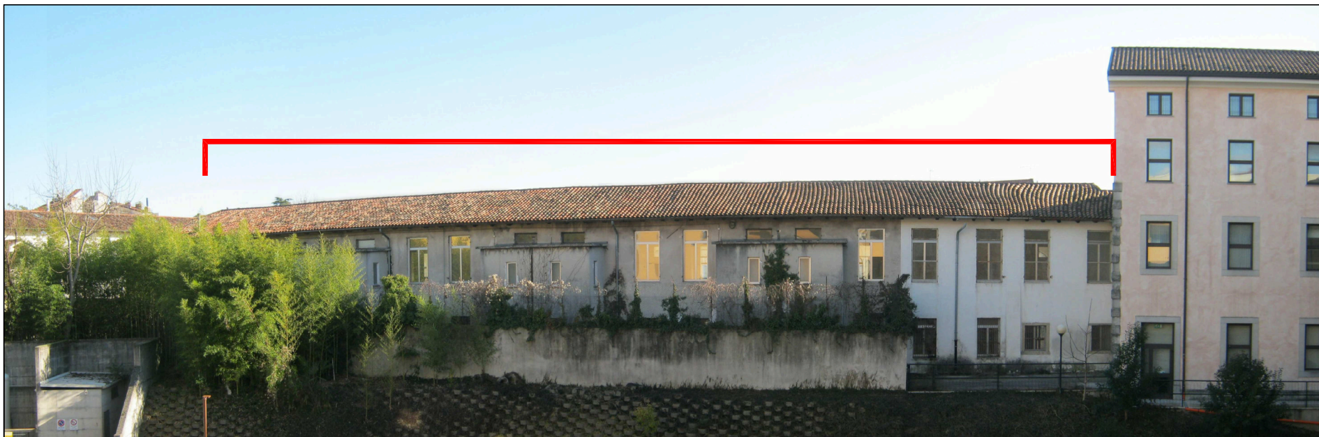
FOTO 2 - PROSPETTO NORD (DALL'INTERNO DELLA PROPRIETA' "LA QUIETE")