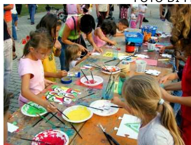
FOTO DI PRECEDENTI INTERVENTI EFFETTUATI DAL LUDOBUS